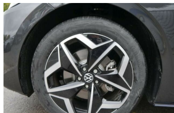
Autohaus Fr.Widmann GmbH*DAS MEHRMARKEN AUTOHAUS*