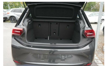
Autohaus Fr.Widmann GmbH*DAS MEHRMARKEN AUTOHAUS*