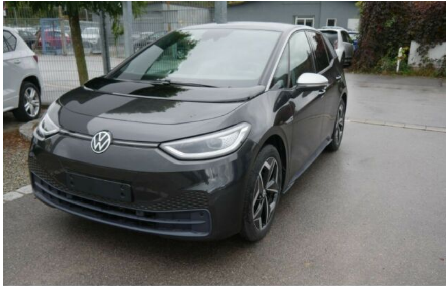
Autohaus Fr.Widmann GmbH*DAS MEHRMARKEN AUTOHAUS*