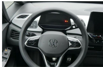
Autohaus Fr.Widmann GmbH*DAS MEHRMARKEN AUTOHAUS*