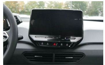
Autohaus Fr.Widmann GmbH*DAS MEHRMARKEN AUTOHAUS*