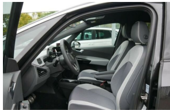
Autohaus Fr.Widmann GmbH*DAS MEHRMARKEN AUTOHAUS*