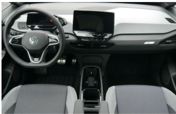
Autohaus Fr.Widmann GmbH*DAS MEHRMARKEN AUTOHAUS*