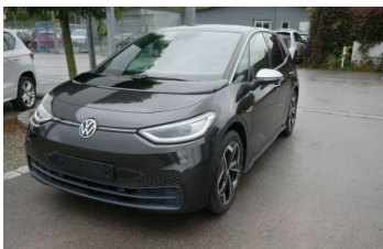
Autohaus Fr.Widmann GmbH*DAS MEHRMARKEN AUTOHAUS*