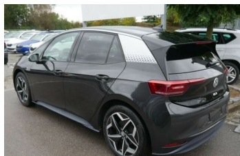
Autohaus Fr.Widmann GmbH*DAS MEHRMARKEN AUTOHAUS*